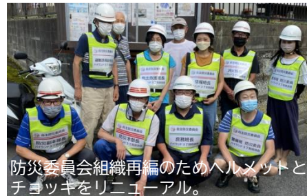
防災委員会組織再編のためヘルメットとチョッキをリニューアル。