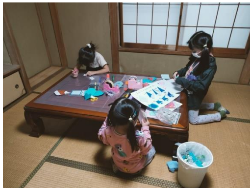
↑子ども会の折り紙コーナー。入れ代わり立ち代わり子どもたちも楽しそう。お父さん、スカリン折れたよ(^)/