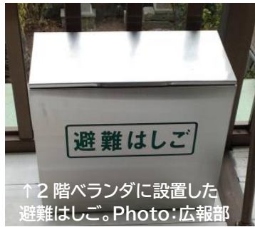
↑2階ベランダに設置した避難はしご。