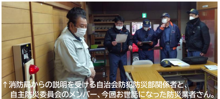
↑消防局からの説明を受ける自治会防犯防災部関係者と、自主防災委員会のメンバー、今回お世話になった防災業者さん。