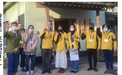
↓役員で来館者に手を振ってお見送り。また来てね。