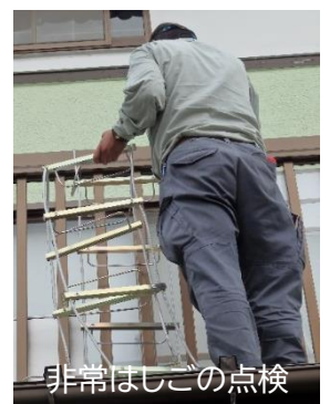
非常はしごの点検