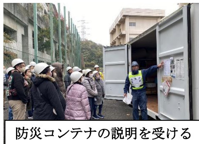
防災コンテナの説明を受ける