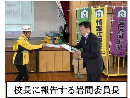
校長に報告する岩間委員長