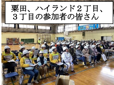
栗田、ハイランド2丁目、3丁目の参加者の皆さん